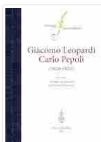
Le missive scambiate con Carlo Pepoli

Il primo libro (170 pagine, 35,00 euro) è intitolato "Carteggio Giacomo Leopardi - Carlo Pepoli (1826-1832)"; la curatela risulta di Andrea Campana e Pantaleo Palmieri. Ricostruisce la storia di amicizia fra due coetanei che avevano in comune l'origine aristocratica, la formazione culturale, l'amore per i classici e la poesia. Quanto a carattere, erano differenti: riservato e riflessivo il primo, espansivo e impetuoso il corrispondente, vissuto tra il 1796 e il 1881. Diversissimi poi per visione ideologica: ripiegato sull'amara condizione dell'uomo uno, protagonista della storia d'Italia come politico l'altro.