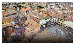
'Non voglio installare dissuasori per volatili'