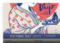
Sake Days 2023