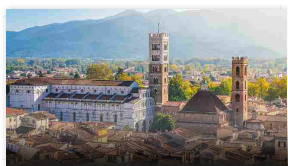
Lucca si specchia nella sua cattedrale