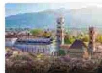
Lucca si specchia nella sua cattedrale