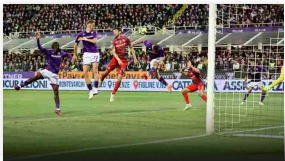
Fiorentina in finale di Coppa Italia