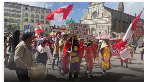
Perù: oggi la manifestazione nazionale a Firenze