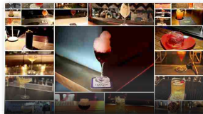
Si è conclusa la Settima Edizione di Florence Cocktail Week