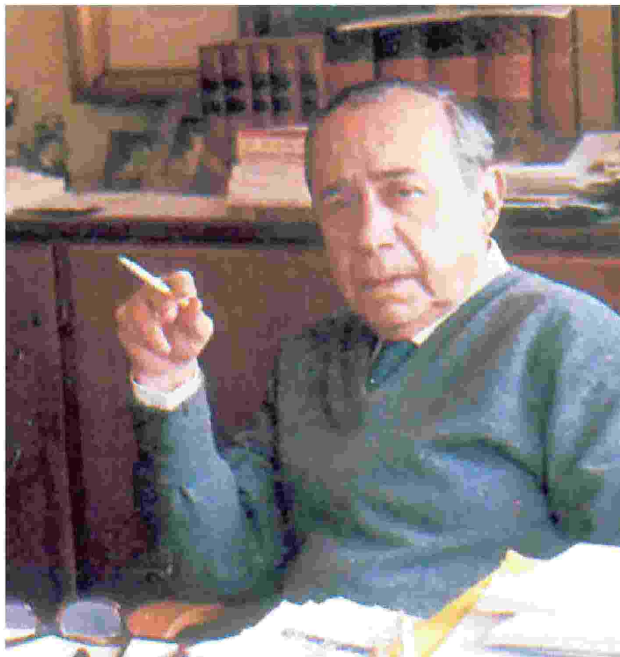
Leonardo Sciascia (Racalmuto, 1921 – Palermo, 1989), scrittore, giornalista, poeta, politico

"Ispezioni della terribilità. Leonardo Sciascia e la giustizia", a cura di Lorenzo Zilletti e Salvatore Scuto, è pubblicato dalla casa editrice Olschki (296 pagine, 35 euro, con un ricco apparato iconografico)