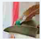
FOTO. Sant'Antonio: salamelle, frittelle e tradizione. Varese aspetta il Falò dei desideri

Mesenzana ricorda caduti e dispersi della battaglia di Nowo Postojalowka con una camminata