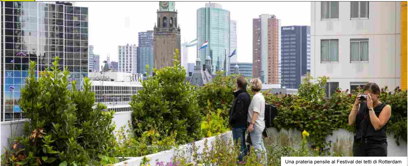
Una prateria pensile al Festival dei tetti di Rotterdam