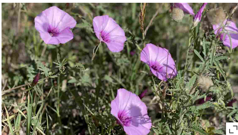
Il convolvolo rosso