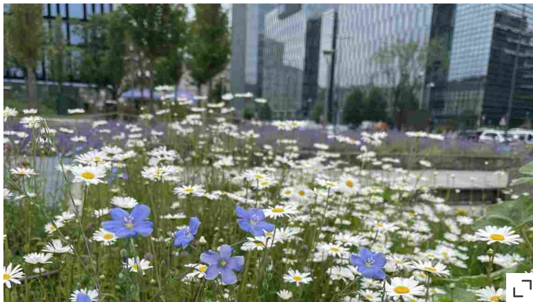
Un prato di lino e margherite

delle vanesse e per le ombrellifere che sostengono altre farfalle, come i macaone, o ancora i cardi. Questo ci ricorda che balconi e giardini non vanno guardati solo con i nostri occhi, ma dobbiamo andare oltre gli aspetti decorativi per sostenere tutte le forme di natura urbana.