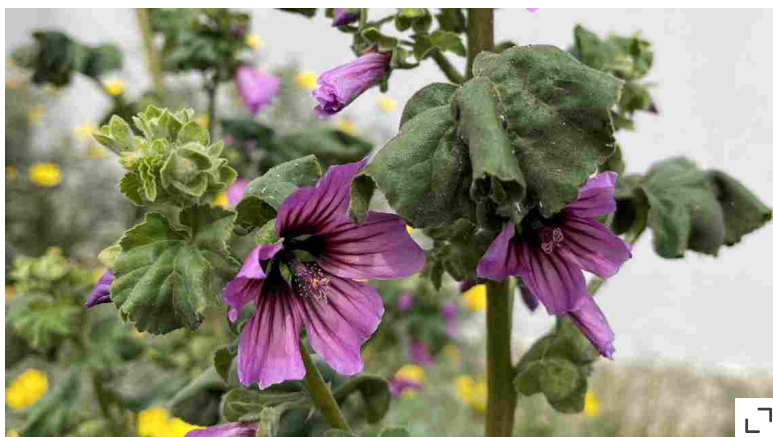
I fiori della malva

Decidere di lasciare almeno un quadrato di erba alta per un effetto prateria presenta moltissimi vantaggi perché "riequilibra" la biodiversità del giardino, accogliendo piccoli predatori dei comuni parassiti delle piante. Questa tecnica si chiama gestione differenziata dei prati ed è impiegata da anni nel verde pubblico di molte capitali europee, anche per ridurre i costi di manutenzione. Se al Parco Nord e al Parco Agricolo Sud di Milano oggi fanno notizia grilli e lucciole (abili predatrici di lumache), per esempio, è merito dei prati alti. Per creare la magia di un giardino, basta disegnarci in mezzo un sentiero ritagliandolo nell'erba. Il resto lo fa la natura: tra le prime erbe alte ad arrivare, le cicorie selvatiche , con un raro tono di azzurro solo al mattino, le Oenothera biennis , gialle, le carote selvatiche, amate da coccinelle e coleotteri e la centaurea, preferita dalle farfalle. Anche in questo caso, si falcia solo in estate per dare il tempo ai semi di cadere e poi all'inizio della primavera, per far sfarfallare i bruchi.