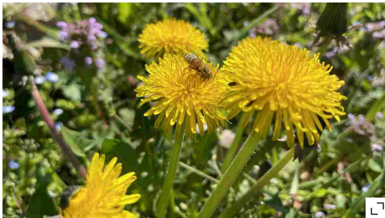
Fiori di tarassaco