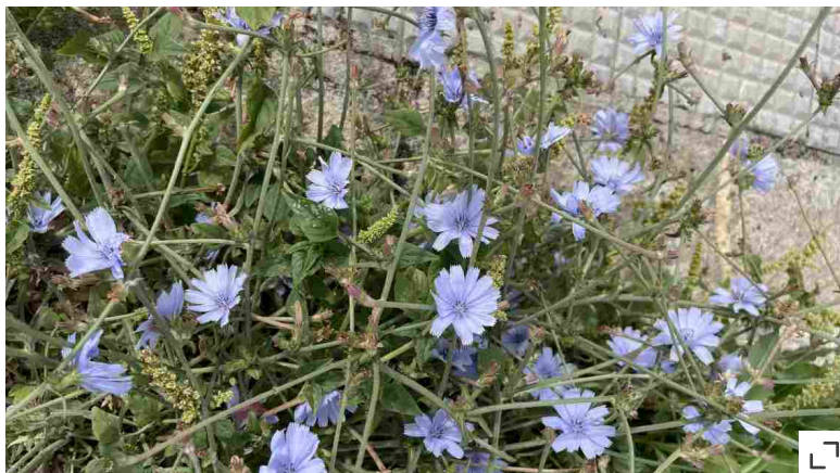
I fiori della cicoria selvatica