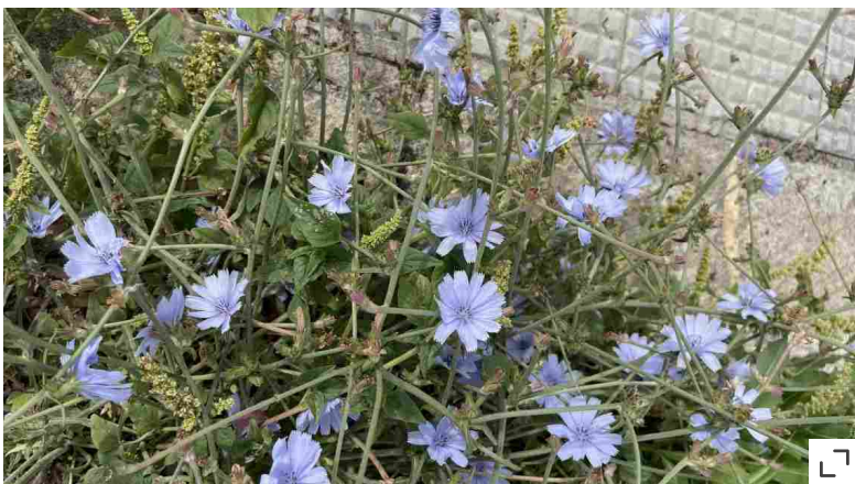
I fiori della cicoria selvatica