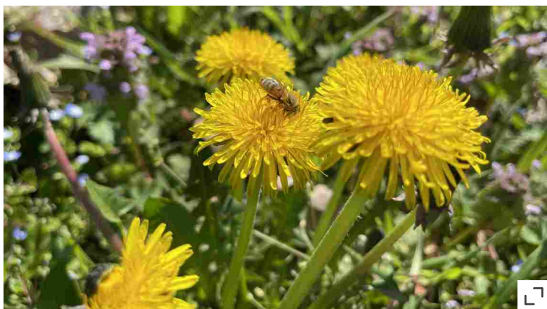
Fiori di tarassaco

Le viola mammola è una garanzia: in un pezzetto di terra indisturbato questa piantina perenne arriva nel giro di una stagione sfruttando un passaggio dalle formiche, che diffondono i suoi semi, come fanno anche con bucaneve e anemoni. Ama l'ombra ai piedi di una siepe oppure sotto gli alberi decidui e corre molto velocemente sul terreno comportandosi da coprisuolo. Per riempirne il giardino o portarla nei vasi, possiamo spostarne una piantina dopo la fioritura, tenendola bagnata finché attecchisce. Altri fiori da ombra pronti a colonizzare lo spazio sono l' aglio orsino e la scilla silvestre . Per cominciare con il wildlife gardening , dunque, dedichiamo alla natura almeno un metro quadrato del giardino o una grande fioriera. Nei condomini e nelle scuole, per esempio, possiamo recintare un fazzoletto di terra con legnetti e spago e scriverci "casa la natura", per il divertimento dei piccoli Darwin che impazziranno per le fioriture spontanee.