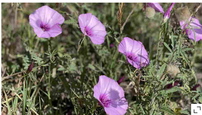
Il convolvolo rosso