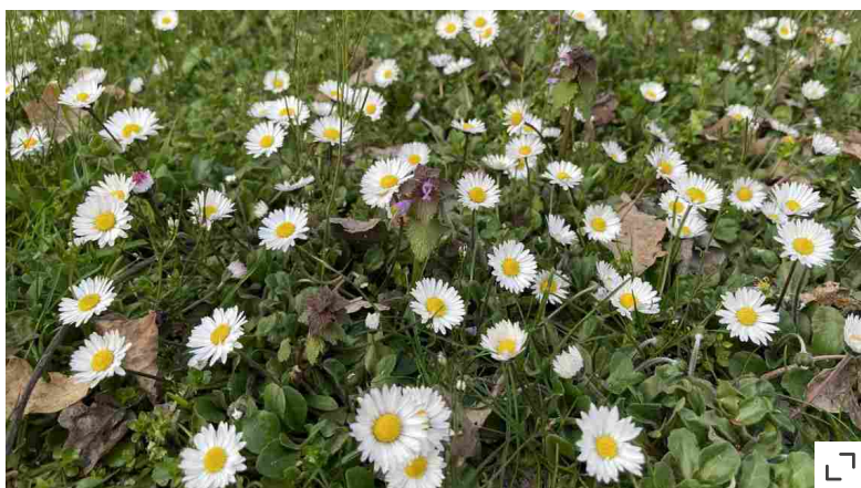
La fioritura delle pratoline

Tra i fiori più precoci c'è il tarassaco : è giallo per attirare i primi impollinatori, che vedono molto bene questo colore e il bianco. Le sue corolle non hanno nulla da invidiare a un sontuoso crisantemo e anche i semi, che assomigliano a quelli dei soffioni, sono belli da vedere. Grazie alla loro capacità di volare lontano, arrivano nel prato da soli. Accogliere questi e altri fiori amati dagli impollinatori, aggiunge al giardino la meraviglia di moltissimi gioielli alati, tra api, coleotteri e farfalle , come insegna l'imperdibile saggio illustrato Ronzii. Storie di api e di altri impollinatori , di Giovanna Olivieri (Pendragon). Un rimedio per contrastare la biofobia, la paura ingiustificata degli esseri viventi che si può guarire con la conoscenza. Tornando al tarassaco, fiori e foglie si possono mangiare in insalata ed hanno proprietà purificanti. Per seminarlo in vaso, raccogliamo i semi quando sono ancora sullo stelo, adagiamoli sulla terra e bagniamo.