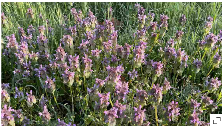
La falsa ortica, Lamium purpureum

fioritura, così i semi avranno il tempo di maturare. Adottiamo la tecnica del mulching , che lascia cadere sul prato gli steli tagliati, restituendo alla terra la sostanza organica (scompaiono in pochi giorni) e regoliamo le lame del tosaerba sul livello più alto, a 4-5 centimetri, affinché il terreno resti sempre in ombra (per il risparmio idrico e per consentire al microbiota di continuare a lavorare).