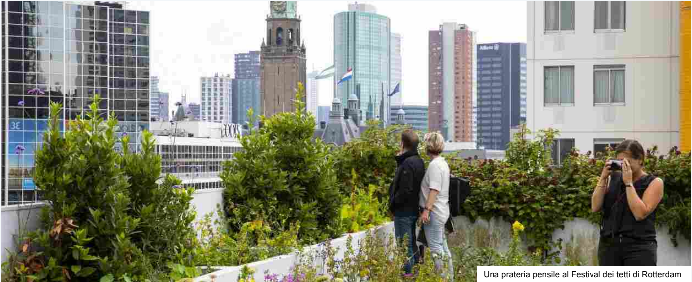
Una prateria pensile al Festival dei tetti di Rotterdam