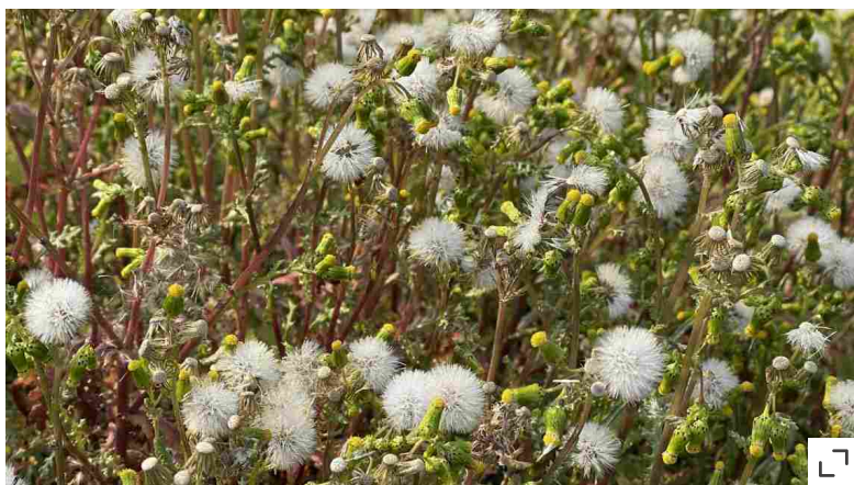
Un prato di senecione

Se scegliamo di non intervenire affatto, e quindi di non tagliare nemmeno l'erba alta, il terreno viene colonizzato da arbusti come buddleje, nicotiane, oleandri o scabiose che preparano il terreno a giovani alberi come pioppi o pini (a seconda dell'ambiente). In pochi step si arriva al bosco. Questo meccanismo che abbiamo semplificato all'estremo si chiama successione ecologica . Se abbiamo spazio, dunque, possiamo scegliere di dare libertà all'evoluzione naturale fino in fondo almeno in un angolo di terra. E a questo punto, potremo tirare le somme delle scelte fatte anche in tema di carbonio, tenendo conto che un metro quadrato di erbacee perenni o di prateria alta assorbe in media 3,21 chili di CO 2 all'anno, uno di arbusti 19,54 chili, uno di giovani alberi 40,38, mentre un albero di piccole dimensioni tipo melograno 376 chili e uno di prima grandezza 3.250 chili . Il miglior insegnamento in materia ce lo ha dato il filosofo e giardiniere francese Gilles Clément ( Il giardino in movimento , Quodlibet) che nel parco Henri Matisse di Lille ha creato un'isola inaccessibile al pubblico per far osservare l'evoluzione della natura.