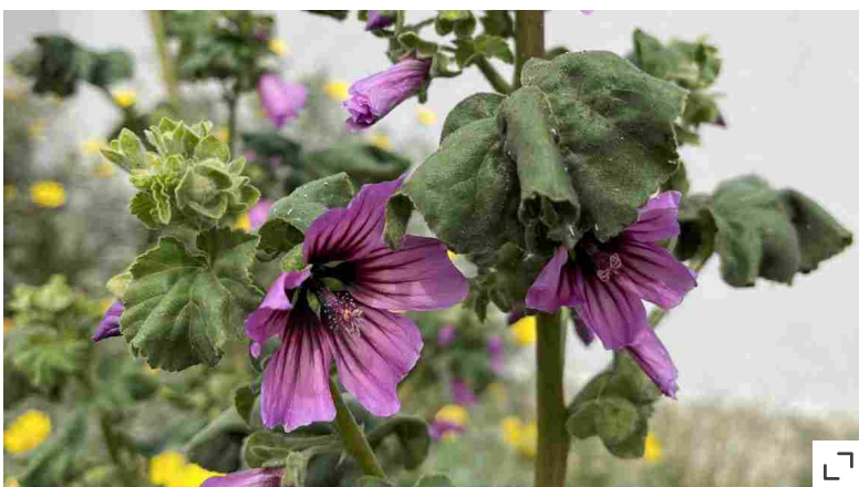
I fiori della malva

Decidere di lasciare almeno un quadrato di erba alta per un effetto prateria presenta moltissimi vantaggi perché "riequilibra" la biodiversità del giardino, accogliendo piccoli predatori dei comuni parassiti delle piante. Questa tecnica si chiama gestione differenziata dei prati ed è impiegata da anni nel verde pubblico di molte capitali europee, anche per ridurre i costi di manutenzione. Se al Parco Nord e al Parco Agricolo Sud di Milano oggi fanno notizia grilli e lucciole (abili predatrici di lumache), per esempio, è merito dei prati alti. Per creare la magia di un giardino, basta disegnarcene in mezzo un sentiero ritagliandolo nell'erba. Il resto lo fa la natura: tra le prime erbe alte ad arrivare, le cicorie selvatiche , con un raro tono di azzurro solo al mattino, le Oenothera biennis , gialle, le carote selvatiche, amate da coccinelle e coleotteri e la centaurea, preferita dalle farfalle. Anche in questo caso, LA STAMPA estate per dare il tempo ai semi di cadere e poi all'inizio della primavera, per far sfarfallare i bruchi.