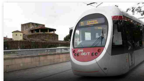
Tramvia al Duomo, anzi no: cosa succede in Giunta?