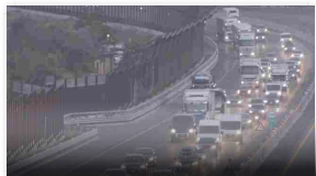
Incidente in A1 tra Firenze Sud e Incisa risolto alle 16,30