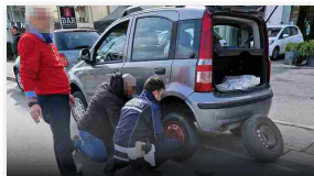
Vigili gommisti per aiutare un anziano in difficoltà