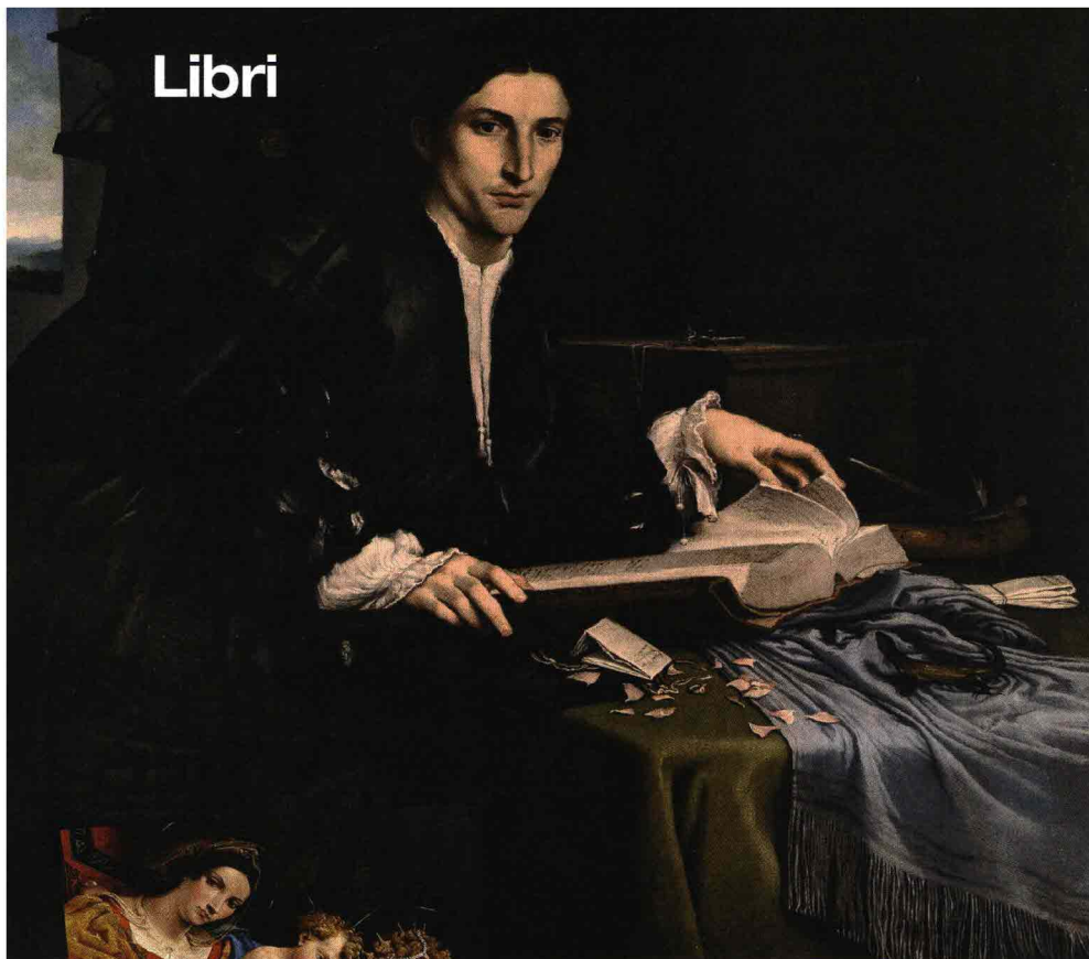
A SINISTRA: "Ritratto di giovane malinconico" di Lorenzo Lotto, 1532 circa, tela, cm 97x110.