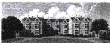
Parte aggiunta da Brown. Fronte meridionale originale. Parte aggiunta da Brown.

Chi volesse anche vedere che cosa resta oggi dei giardini progettati da Repton, può consultare il libro illustrato edito da Rizzoli, in inglese, dove si torna in 15 dei suoi progetti, facendo dialogare gli acquerelli con le fotografie attuali, da Mulgrave Castle nel Nord Yorkshire, a Brightling in East Sussex, a Endsleigh Cottage nel Devon.