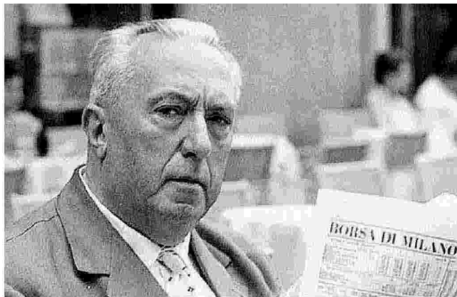
Sopra, Carlo Emilio Gadda. A destra, la copertina del volume di Adelphi appena uscito

gran parte inedite, conservate nel Fondo Gadda del Gabinetto Vieusseux e in parte nel Fondo Liberati e presso gli eredi Bonsanti, che documentano un sodalizio tra i più significativi del Novecento italiano, mettendo in luce il percorso biografico e letterario-editoriale di Gadda, insieme al ruolo fondamentale svolto da Bonsanti nel sostenerlo e nel sollecitarlo a scrivere. Un'amicizia che perdura intatta tra le difficoltà della vita quotidiana e le tragedie della storia, in un'Italia che dai tetri anni del fascismo si evolve verso una faticosa e frastornante modernità.