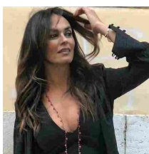
Pesca, Maria Grazia Cucinotta testimonial di uno spot sulle qualità del pescato siciliano