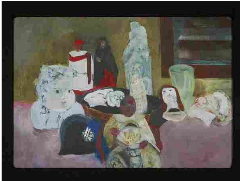
Mario Lattes, Natura morta, s.d., tecnica mista su cartoncino

Dal 16 Settembre 2023 al 03 Dicembre 2023