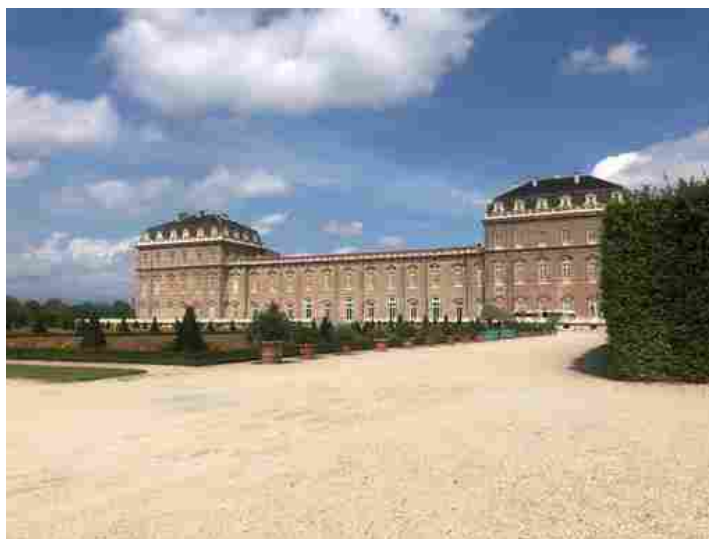
La Reggia di Venaria

In autunno i prossimi appuntamenti per il centenario della nascita dell'artista