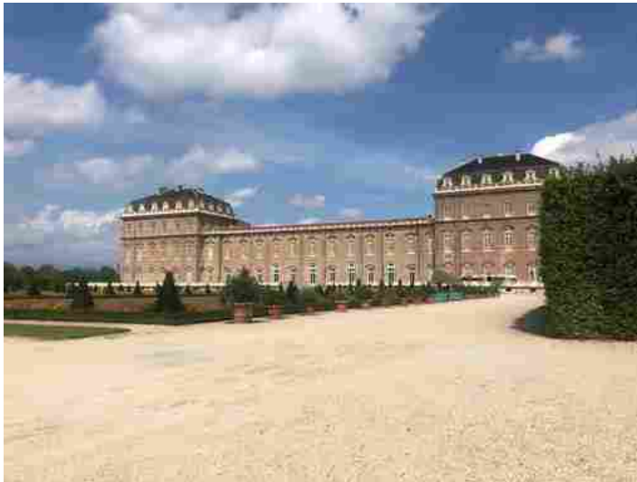
La Reggia di Venaria

In autunno i prossimi appuntamenti per il centenario della nascita dell'artista