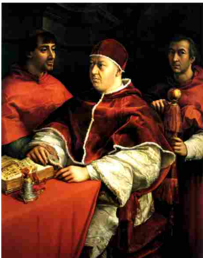
Raffaello Ritratto di Leone X tra i cardinali Giulio de' Medici e Luigi de' Rossi

E proprio dalla morte e dal post mortem parte la grande mostra Raffaello 1520-1483 (Roma, Scuderie del Quirinale , 5 marzo – 2 giugno), che non a caso mette nel titolo la data al contrario. Chiusa purtroppo in tempo di "coronavirus", la rassegna presenta 120 opere tra dipinti e disegni dell'artista e 100 del contesto . Capolavori che ne illustrano vita e attività, dal periodo romano, 1508 -1520, a quelli fiorentino e urbinato. Prestiti importanti sono giunti da tutte le parti del mondo, con qualche polemica. È caso del Ritratto di Leone X con i cardinali Giulio de' Medici e Luigi de' Rossi , giustamente concesso alla mostra dal direttore degli Uffizi contro il parere di alcuni storici. Gli Uffizi hanno prestato 49 opere, di cui 30 di Raffaello.