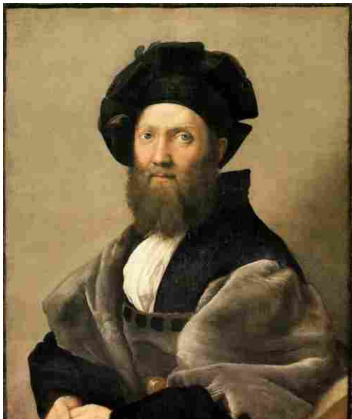
Raffaello Ritratto di Baldassarre Castiglione

Il Ritratto di giovane donna, forse sempre la stessa che l'aveva stregato sino a farlo morire.