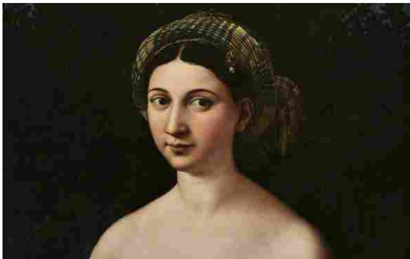
Raffaello, Ritratto di donna nei panni di Venere (Fornarina)

Il 6 aprile 1520 muore a Roma, a trentasette anni, Raffaello Sanzio, il più grande pittore del Rinascimento. La città sembra fermarsi nella commozione e nel rimpianto. Il 5 marzo 2020 la mostra Raffaello 1520-1483 riporta il genio del pittore in città. Nemmeno la chiusura generale dettata dal governo ferma l'esposizione, visitabile al momento tramite il sito del museo.