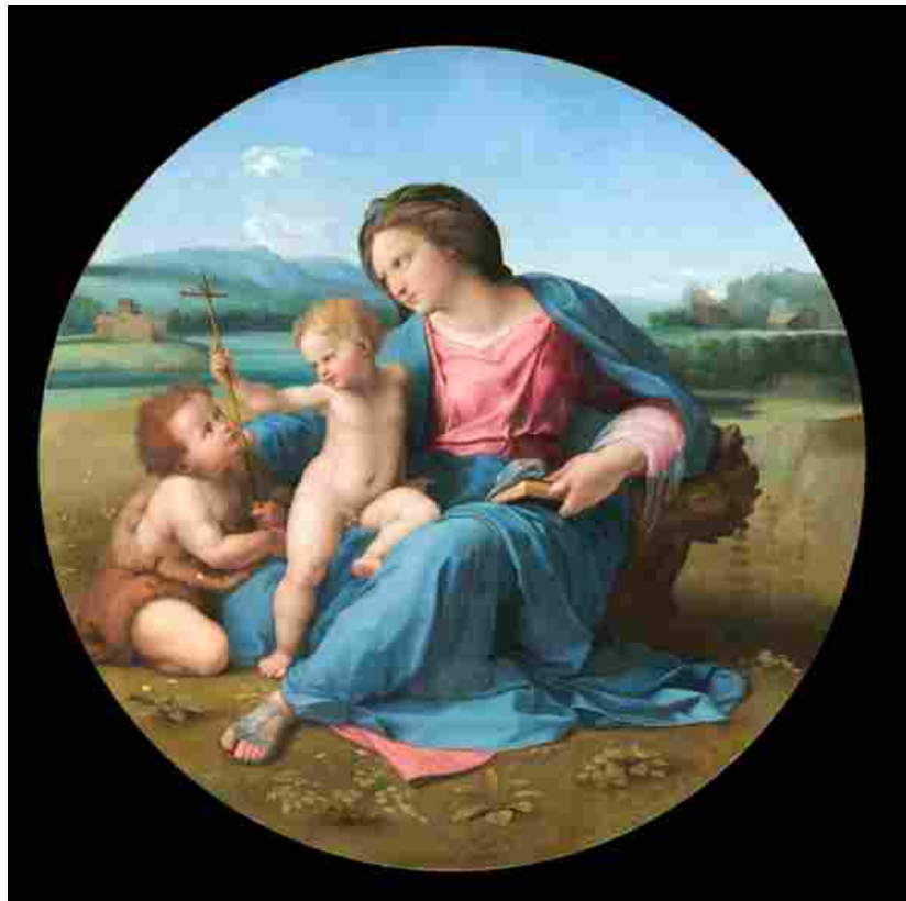
Raffaello Madonna con il Bambino e San Giovannino (Madonna d'Alba)