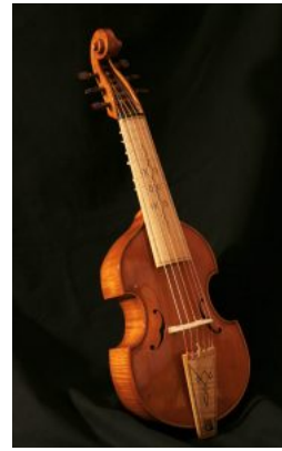
Viola da gamba