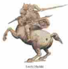
PALAZZO VECCHIO BATTAGLIA DI ANGHIARI COVER

La Sala Grande di Palazzo Vecchio e la Battaglia di Anghiari di Leonardo da Vinci Dalla configurazione architettonica all'apparato decorativo