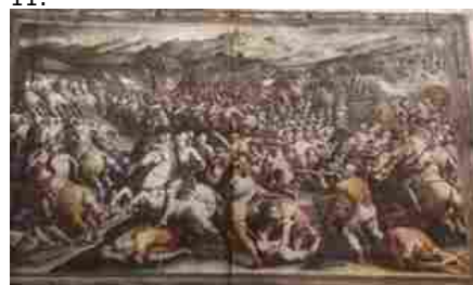
PALAZZO VECCHIO BATTAGLIA DI ANGHIARI