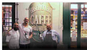
Vino e Rugby da Burde