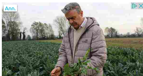
Scopri i produttori locali

Il prossimo mercoledì 13 marzo, alle ore 17,00, presso la sala Castiglioni della biblioteca Mozzi Borgetti, si terrà l'ultimo incontro del ciclo di conferenze "Il Racconto e i Falò, quando il Paesaggio diventa un personaggio letterario". Filo rosso degli appuntamenti che si sono susseguiti finora è il rapporto tra letteratura e paesaggio e si parlerà di come i luoghi e le ambientazioni influiscano sulle vicende narrate all'interno dei tanti capolavori di cui è costellata la storia della letteratura.