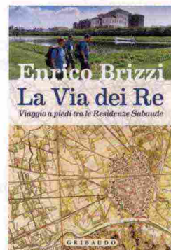
★ La Via dei Re, di Enrico Brizzi, Gribaudo 2018, 304 pagine, 14,90 €. Formato: 13x20 cm

Il racconto degli episodi salienti della storia della dinastia detta il ritmo della lunga camminata nello spazio e nel tempo, che dai palazzi torinesi va alla villa della Regina, quindi si inoltra verso le residenze di caccia di Venaria Reale e Stupinigi e segue la corona dei castelli: la Mandria, Rivoli, Moncalieri, Racconigi, Govone e Agliè.