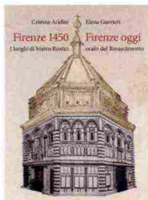
★ Firenze 1450 - Firenze oggi. I luoghi di Marco Rustici orafò del Rinascimento, di Cristina Acidini ed Elena Gurrieri, Olschki 2018, 128 pagine, 14 €. Formato: 15x21 cm