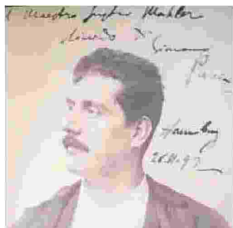
A sinistra: una fotografia di Giacomo Puccini con dedica autografa a Gustav Mahler, Amburgo, 28 novembre 1892. Nell'altra immagine una foto di gruppo scattata nei primi anni del '900. A sinistra Antonio Puccini dietro il padre Giacomo