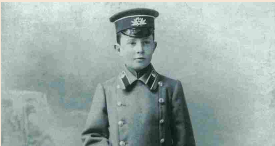
Lettoce precoce. Alexandre Koyré I in divisa ai primi del '900