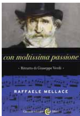
Raffaele Mellace, Con moltissima passione. Ritratto di Giuseppe Verdi, Carocci Editore, Roma 2013, pp. 302, € 19,00