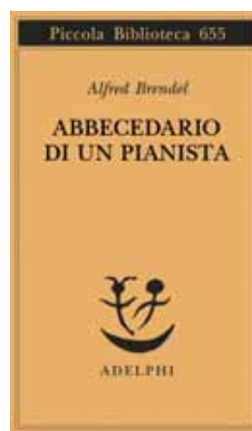
Alfred Brendel, Abbecedario di un pianista. Un libro di lettura per gli amanti del pianoforte, disegni di Gottfried Wiegand, Adelphi, Milano 2014, pp.156, € 12