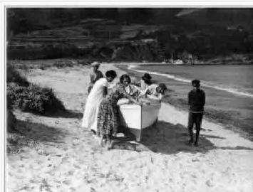
sulla spiaggia di Procchio

Roster, Del Greco, Rapisardi, Olschki: un clan di collezionisti, garibaldini, scienziati e imprenditori in sessanta stupende fotografie d'inizio Novecento