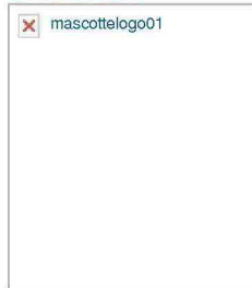
Quando le immagini parlano»