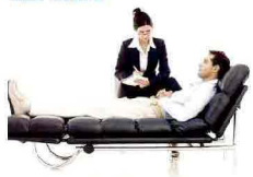
Anoressia, ansia, panico, gastriti, sesso. »