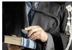
Poni gratuitamente le tue domande ad un avvocato. »