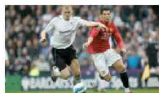
Calcio e attività sportive»

Registrazione per vedere cosa piace ai tuoi amici.