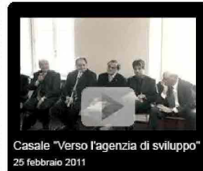
Casale "Verso l'agenzia di sviluppo" 25 febbraio 2011