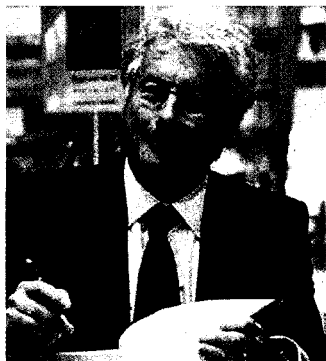
Il romanziere Ken Follett