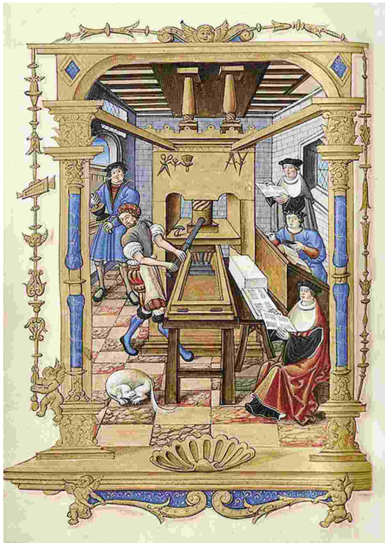
Stampatori al lavoro: da "Chants royaux sur la Conception, couronnés au puy de Rouen de 1519 à 1528", sedicesimo secolo, Biblioteca nazionale di Francia