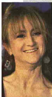
LUCIANA LITIZZETTO LA JOLANDA FURIOSA