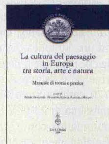
A cura di Pierre Donadieu , Hansjorg Kuster , Raffaele Milani Leo S. Olschki, 2008 (pp. XII + 194, € 18,00)

Il tutto mirando sempre ad un equilibrio tra innovazione e conservazione. A questo proposito - avverte uno dei curatori - «in un momento nel quale le risorse dell'ambiente e la qualità del territorio sembrano fortemente minacciate, il paesaggio che le comprende può diventare un luogo di alta progettualità, portando finalmente il seme di una buona relazione tra modernità e tradizione». ■