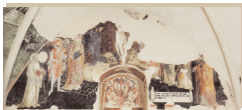
Lorenzo Salimbeni, Crocifissione e santi; 407. Sanseverino Marche, chiesa di San Lorenzo in Doliolo, sagrestia

* È autore di diversi saggi sulla pittura italiana di età tardogotica e rinascimentale, con preferenza per l'area adriatica e centroitaliana. Le sue ricerche sono state pubblicate negli atti di convegni internazionali ai quali ha preso parte, in volumi miscelanei, nonché nelle riviste Paragone, Arte