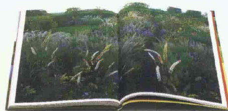
LE JARDIN PLUME di Joëlle et Gilles le Scanff-Mayer, Ed. Ulmer, Pagg. 95, € 25

È UNA DELLE PIÙ GRANDI organizzazioni del mondo che si occupa del patrimonio architettonico storico britannico ( www.nationaltrust.org.uk ). 350 proprietà di cui 200 case, argomento del volume. Per ognuna è riportata una breve scheda e un testo che ne descrive la storia e il contesto geografico. Numerose le case in cui vissero scrittori e personaggi famosi del mondo dell'arte e della politica. Ricco il corredo fotografico, che riporta i tanti interni splendidamente conservati. Al National Trust si ispira il Fai, Fondo per l'ambiente italiano.