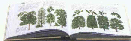
GUIDA ALL'AUTOSUFFICIENZA di John Seymour, Ed. Mondadori, Pagg. 255, € 19

ALTRE NOVITÀ WEEKEND HOMES-SECONDE CASE di Macarena San Martin, Ed. Kolon, Pagg. 255, € 14,90 DESIGN&ITALY "RON ARAD" di Alba Cappellieri, Ed. Mondadori Arte, Pagg. 105, € 19,90 WATER-SAVING GARDENS di Graham Clarke, Ed. Guild of Master Craftsman Publications, Pagg. 160, € 24 LA VALORIZZAZIONE DEI SITI CULTURALI E DEL PAESAGGIO. UNA PROSPETTIVA ECONOMICO-AZIENDALE di Fabio Donato e Francesco Badia, Ed. Leo S. Olschki , Pagg. 230, € 26 I GIARDINI DI MANHATTAN. STORIE DI GUERRILLA GARDENS di Michela Pasquali, Ed. Bollati Boringhieri, Pagg. 140, € 18