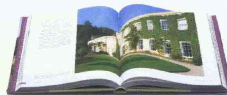
HOUSES OF THE NATIONAL TRUST di Lydia Greeves, Ed. The National Trust, Pagg. 400, € 52,50

TUTTI I PUNTI cruciali della sostenibilità ambientale sono affrontati in questo libro di John Seymour. Dalla coltivazione dell'orto come fonte di cibo all'energia, ai rifiuti. L'autore, scomparso nel 2004, contadino e scrittore, è diventato un punto di riferimento per il suo stile di vita all'insegna del rispetto della natura. La sua associazione oggi edita libri e produce film e documentari. Il libro è stato stampato a impatto zero: l'anidride carbonica prodotta per la sua realizzazione è stata compensata con la riforestazione e tutela di un'area boschiva.