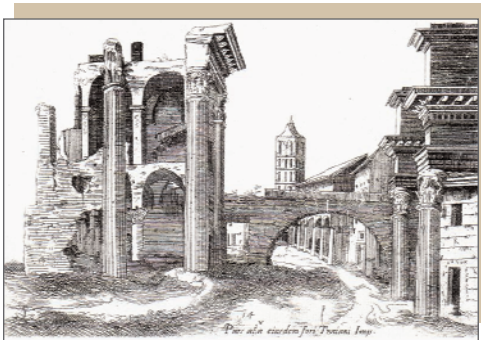
Il foro di Nerva con le rovine del Tempio di Minerva. Inc. G.B. Cavalieri da disegno di A. Dosio, 1569 circa (Roma Palazzo Corsini)

In questo quadro si formò il centro storico della Roma attuale mentre subirono una definitiva sistemazione quelli che noi chiamiamo i quartieri del Rinascimento.