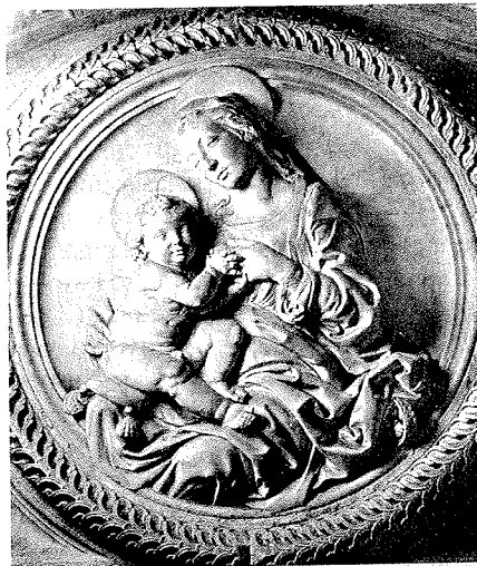
F. di Simone Ferrucci, Sepolcro Tartagni (particolare), 1485-87 ca.

La figura dello scultore fiorentino Francesco di Simone Ferrucci (1437-1493) è rimasta a lungo in ombra per la scarsa considerazione tributatagli da Vasari, che gli dedica solo poche parole nella Vita di Verrocchio . Dopo gli studi di Adolfo Venturi e Cornelius de Fabriczy, alla fine del XIX secolo, l'attenzione verso lo scultore è stata solo saltuaria, tanto da diventare un nome contenitore per ricerche diverse ma ascrivibili al contesto fiorentino. La nutrita monografia dello scultore scritta da Linda Pisani, quindi, colma questa lacuna, rimettendo ordine con perizia nella biografia e nel catalogo del Ferrucci. Il libro pubblicato da Olschki, magnificamente illustrato come tutti i preziosi volumi d'arte dello 'storico' editore fiorentino, fa il punto in maniera organica sul percorso e sulla formazione di questo maestro appartenente alla generazione dei fratelli Polaiuolo, di Verrocchio, Mino da Fiesole e Benedetto da Maino, e ristabilisce il tessuto connettivo degli influssi e degli scambi con i contemporanei. L'ossequio di Ferrucci verso il Verrocchio, ad esempio, non è più visto come frutto di un alun-