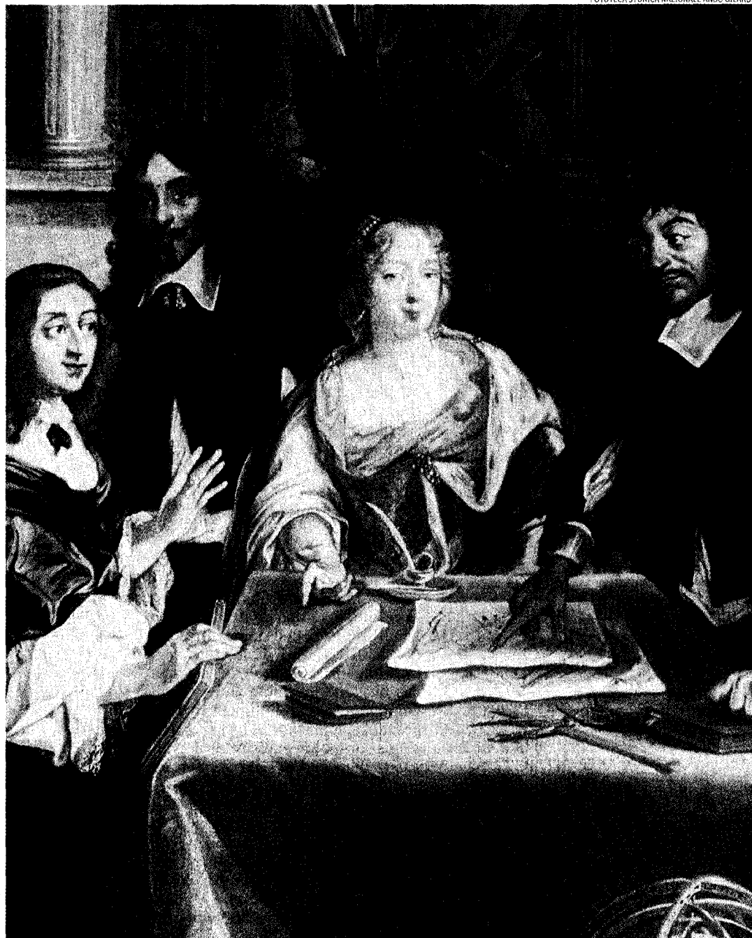
A lezione di matematica. Cristina di Svezia, raffigurata a sinistra, ascolta una dimostrazione geometrica di Cartesio (a destra). Al centro, poco interessata, Elisabetta di Baviera (da un dipinto di Dumesnil, XVII sec.)