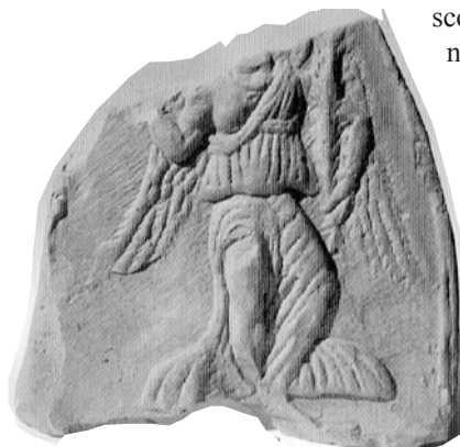
Murella. Terracotta architettonica di età ellenistica

Il collasso del centro arcaico, nel quadro politico omogeneo d'età imperiale, si tradurrà, pur nel rispetto delle prerogative amministrative, in un azzeramento della fisionomia culturale del territorio.