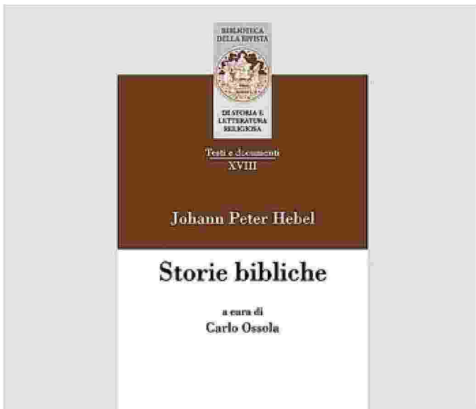
La copertina della riedizione delle Storie bibliche curata da Ossola