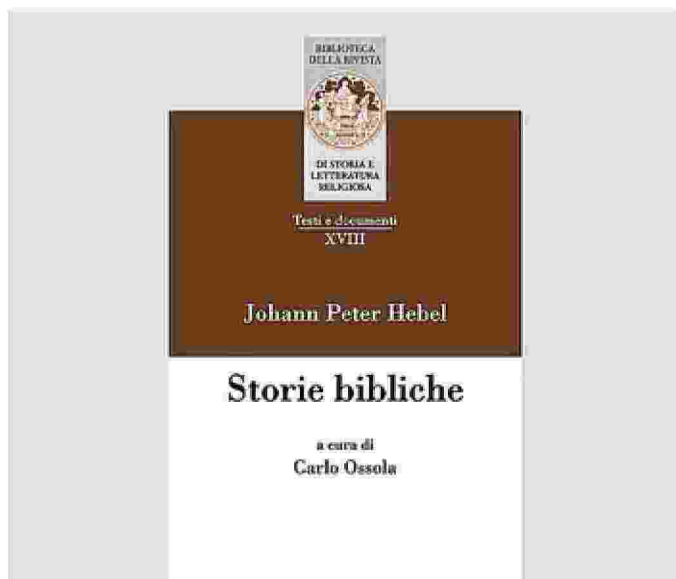
La copertina della riedizione delle Storie bibliche curata da Ossola